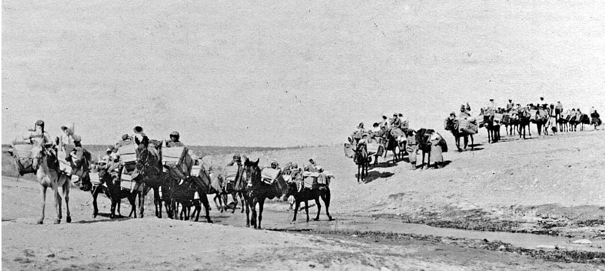
Ein Zug mit Waisenkindern in der Wüstensonne

Berge, durch die Steppe, an plündernden Soldaten vorbei in Sicherheit bringen? Wer – wenn nicht das Ehepaar Künzler, das sich mit der jahrelangen Krankenpflege überall Freunde geschaffen hatte? Es galt, die Hinhaltetaktik der lokalen Behörden zu überwinden, um für jedes der Kinder den nötigen Reisepass zu besorgen, dazu Pferdefuhrwerke, Esel und Lastautos samt Führern zu organisieren, ohne sich betrügen zu lassen. So gelangten in mehreren Tracks 8000 elternlose Kinder in den Libanon. „Sie freuten sich“, schreibt Künzler, „wie einst die Israeliten, als sie der Macht des Pharaos entronnen waren“.